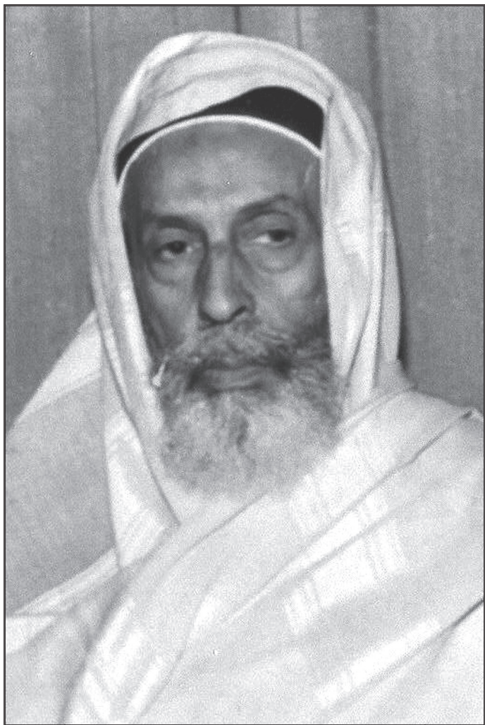
الملك الراحل السيد محمد إدريس المهدي السنوسي ملك المملكة الليبية (١٨٨٩ - ١٩٨٣)