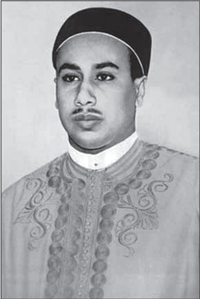
الأمير الراحل السيد الحسن الرضا المهدي السنوسي ولي عهد المملكة الليبية (١٩٢٨ - ١٩٩٢)